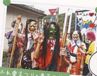
ふれ愛まつり・鬼まつり