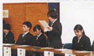
3年生による進路アドバイス