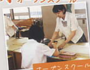
オープンスクール