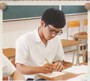
授業に集中! 授業をしっかり聞くことが大切。