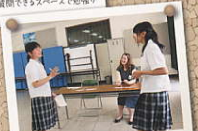
英語が話せるようになりたい! ALTの先生との授業は challenging and fun!