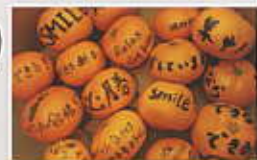
在校生の応援みかん