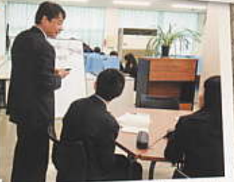
新たな学びのスペースができた! 学習サロン「いみほ」は放課後の自習場所。自習スペースと質問できるスペースで勉強がはかばか!