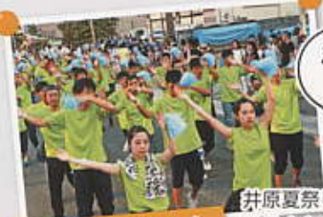
井原夏まつり 踊り連