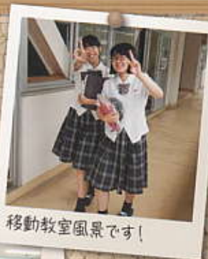
移動教室風景です!