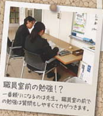
職員室前の勉強!? 一番頼りになるのは先生。職員室の前での勉強は質問もしやすくて力がつきます。