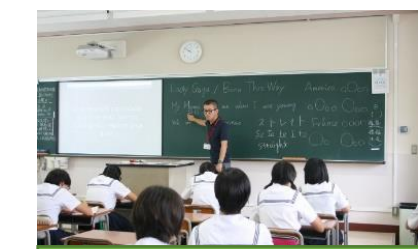
Let's enjoy English songs!