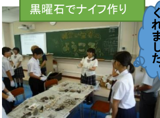
黒曜石でナイフ作り